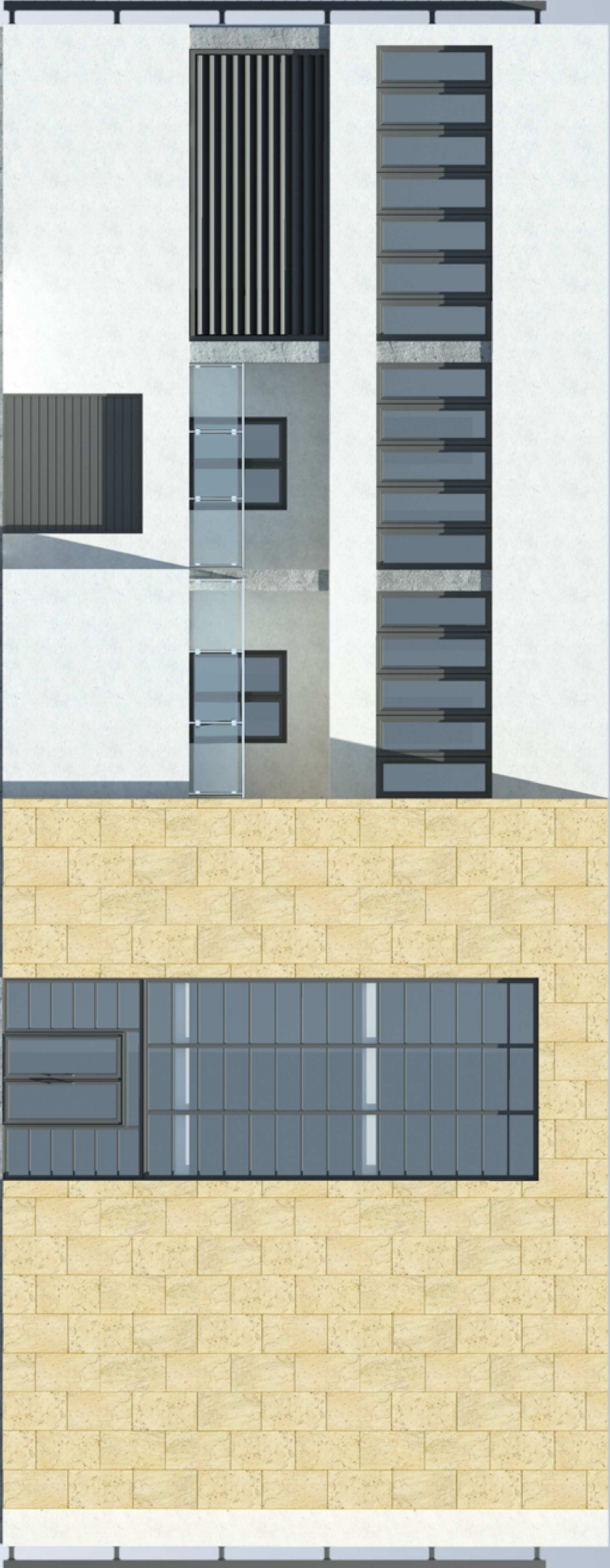
elewacja4 - tylna