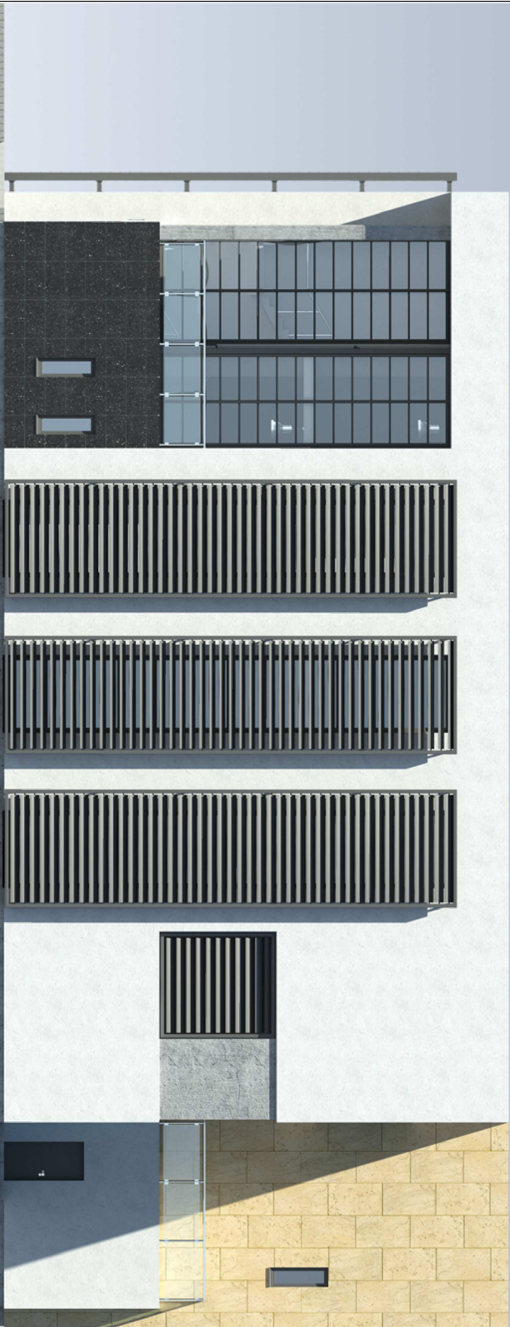
elewacja3 - boczna